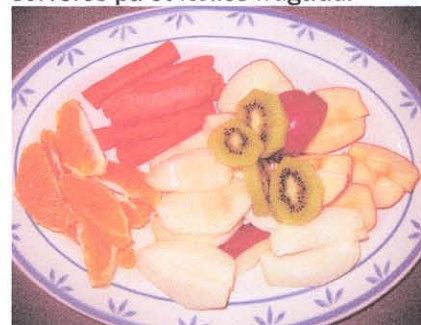
Et typisk frugtfad

Børnene medbringer hver et stk frugt eller grøntsag, som skæres ud og serveres på et fælles frugtfad.